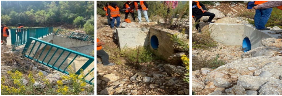
Şekil 11. Orman yollarına yapılan köprü ve büzler incelendi

Bugün aynı zamanda orman yollarının kalitesini düşüren ve hatta bozan yağmur sularının drenajında kullanılan hidrolik sanat yapıları da incelendi (Şekil 11). Bu hidrolik sanat yapılarının büz, menfez ve hatta köprü şeklinde olabileceği ve işletmelerin bu sanat yapılarını yaptırmak amacıyla da ihalelere çıktığı belirtildi. Orman yollarında kullanılan bu hidrolik sanat yapılarının çoğunlukla betonarme olduğu ve aynı zamanda orman yollarına yapılan hendeklerin de suyu yol platformundan uzak tutmak amacıyla yapılıyor olması ise dikkat çeken hususlardı.