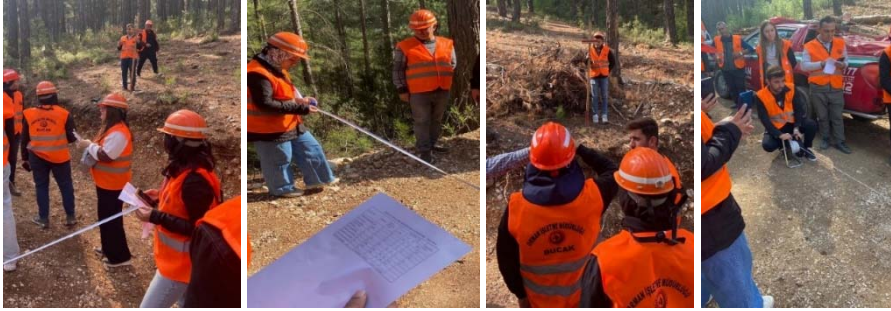
Şekil 10. Orman yolunun özelliklerinin ölçülmesi ve standartlara uygunluğunun denetlenmesi

Burdur ilinin Bucak ilçesinde yeni yapılan bir orman yolunu incelemeye gidildi (Şekil 10). Orman yollarının nereye ve nasıl yapılacağına 1 yıl önceden planlandığı vurgulanırken yolun yapılacağı arazide bir etüt çalışmasının yapıldığına ve etüt yapıldıktan sonra ise yolun ihaleye çıktığına değinildi. Gidilen arazideki orman yolunun B-tipi normal tali orman yolu olduğu, bu yolun platform genişliğinin 4 metre, eğimin maksimum %12, şerit genişliğinin 3 metre ve hendek genişliğinin 1 metre olması gerektiği belirtildi. Yol yapıldıktan sonra ise inşaatı biten orman yolunun standartlara uygun olup olmadığının kontrol edildiğine değinildi.